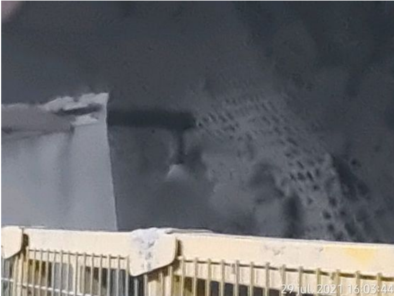
Foto 25: Medida: Regaderas. Lugar: TP1. Comentarios: 3 regaderas operativas en el área