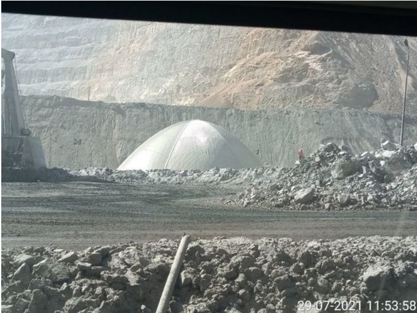
Foto 27: Medida: Espumante en Correas y Stock Pile. Lugar: Chancado 2. Comentarios: producto operativo no se observa material particulado fuera del domo