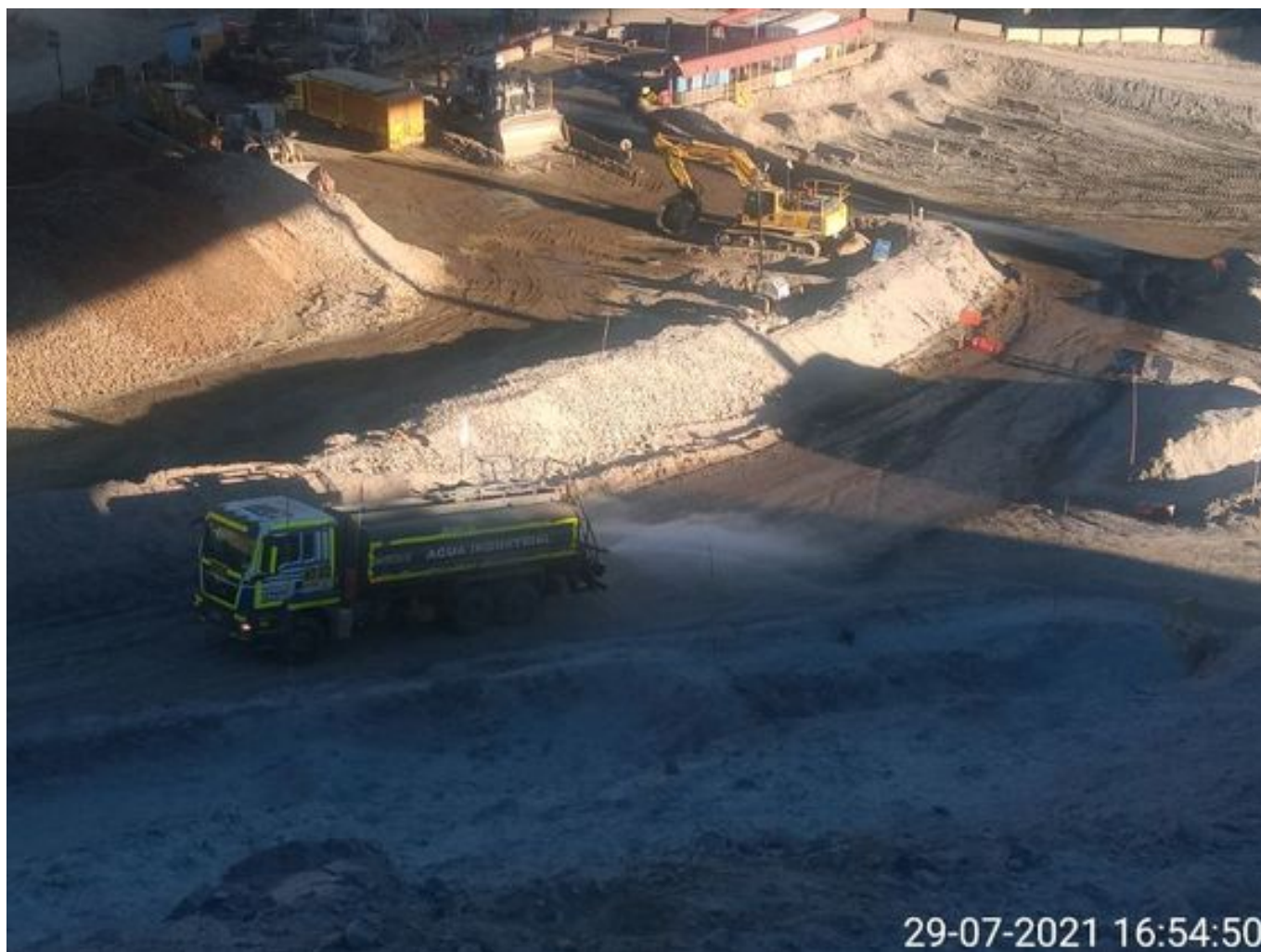
Foto 51: Medida: Riego Caminos. Lugar: Stock pile planta. Comentarios: riego de caminos operativo se observa un camión aljibe besalco humectando