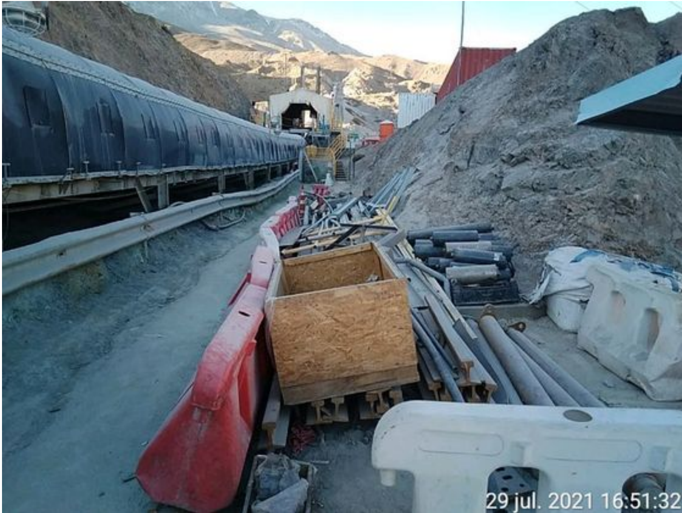
Foto 16: Medida: Limpieza costado Correa CV 007. Lugar: Post-Mantención. Comentarios: costado de la correa operativo