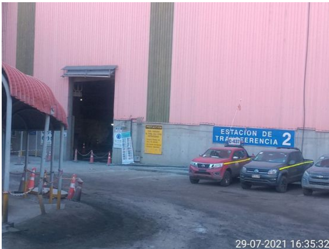
Foto 23: Medida: Regaderas. Lugar: TP2. Comentarios: correas detenidas por falta de mineral en proceso en stock pile de chancado