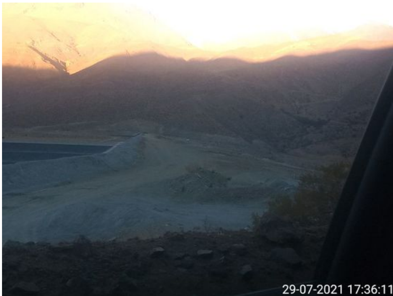
Foto 45: Medida: Aplicación Soiltiac coronamiento del muro. Lugar: Tranque Quillayes. Comentarios: no se observan trabajos en el área