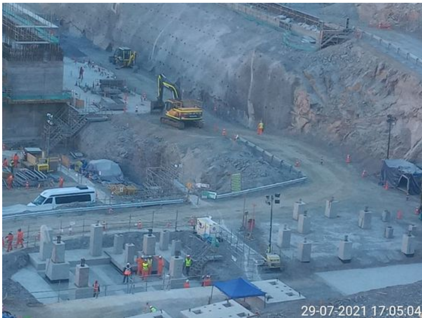
Foto 52: Medida: Riego de frentes de carguio. Lugar: INCO. Comentarios: No se observan trabajos en el área