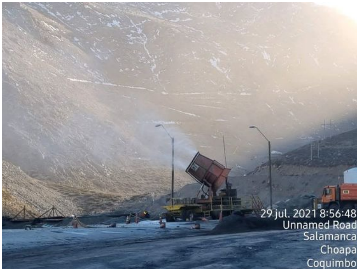
Foto 7: Medida: Fogcannon 1. Lugar: . Comentarios: equipo operativo