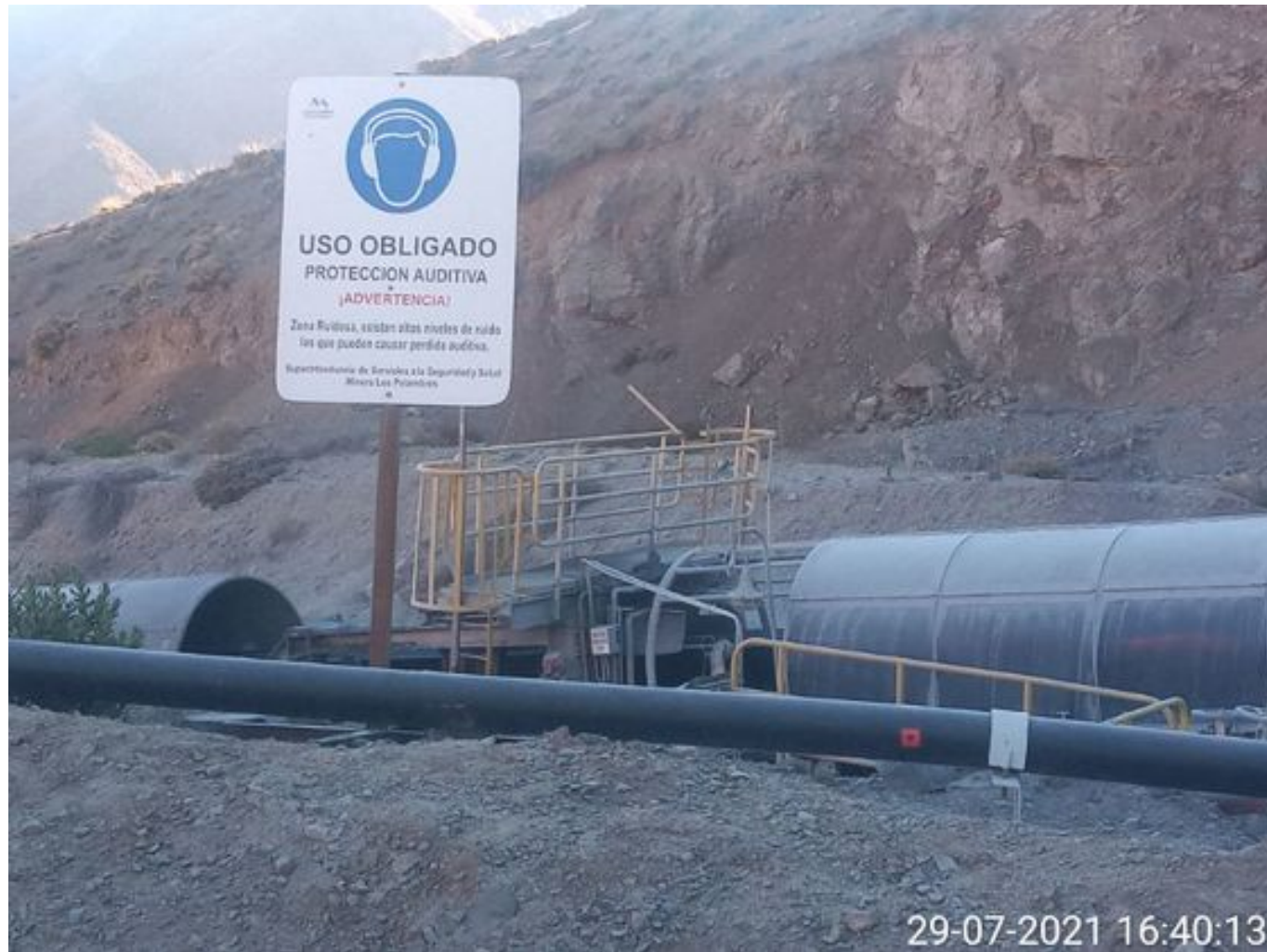
Foto 18: Medida: Regaderas en Correa Transportadora. Lugar: Salida túnel 3. Comentarios: correas detenidas por falta de mineral en proceso en stock pile de chancado