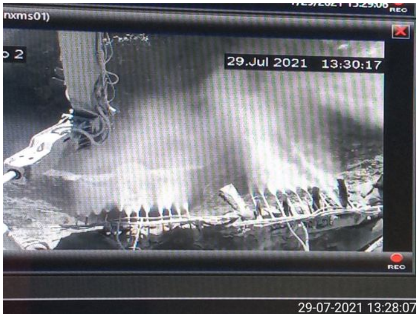
Foto 21: Medida: Supresor de polvo. Lugar: Taza Chancado 2. Comentarios: supresores se observan operativos pero medida no es suficiente para mitigar material particulado en descarga de caex en taza de chancado