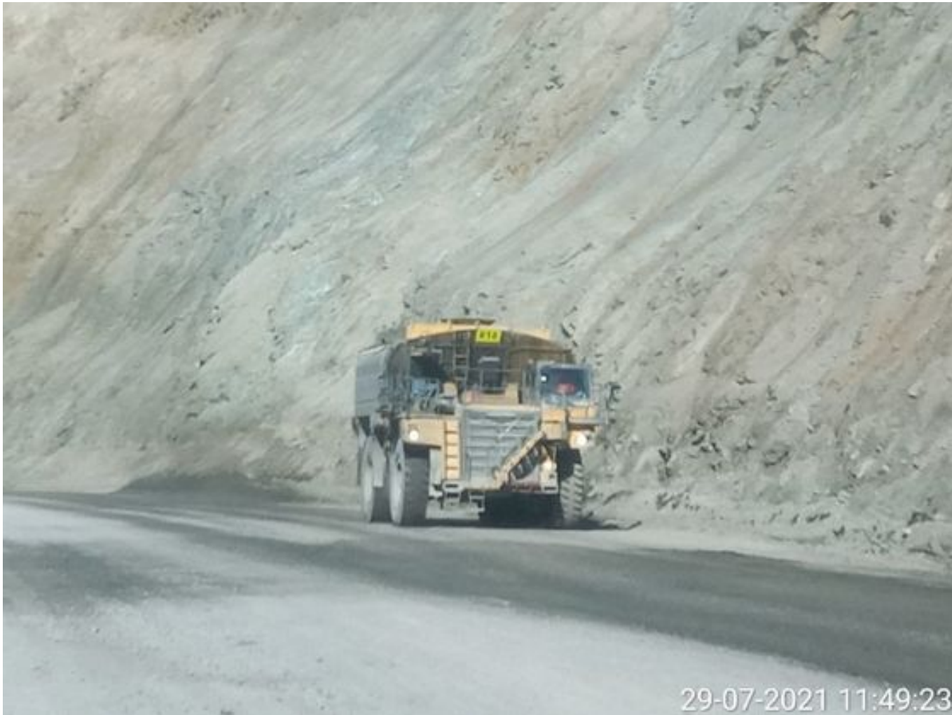
Foto 2: Medida: Riego de caminos. Lugar: Fases Intermedias. Comentarios: rampas con riego y aplicación de producto entre cortado con 2 camiones aljibes besalco en pistas y 3 cachimbas operativas, medida de regadio no es suficiente para mitigar material particulado, fuentes de emisión tránsito de Caex, equipos de apoyo y carguío , descarga de caex en taza de chancado.