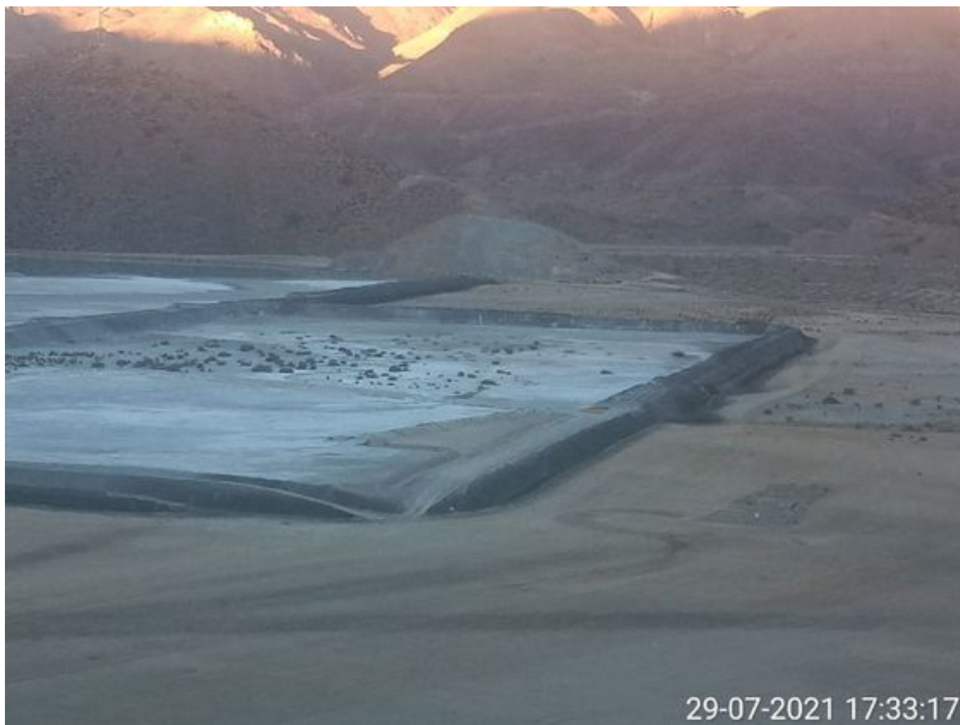
Foto 43: Medida: Aplicación de empréstito. Lugar: Sector Tranque. Comentarios: no se observan trabajos en el área