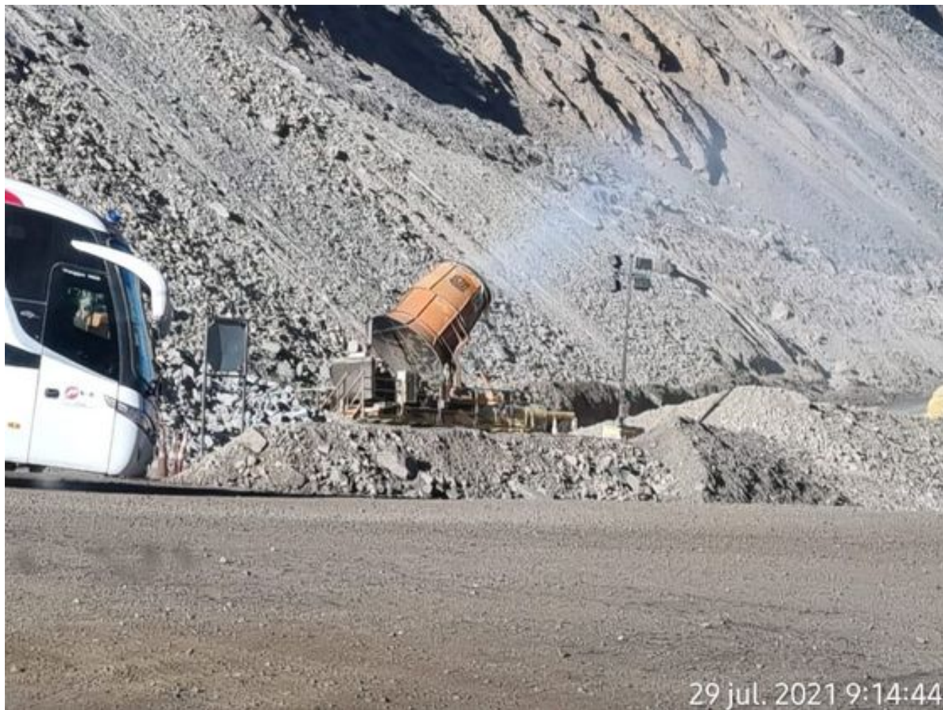
Foto 12: Medida: Fogcannon 2. Lugar: . Comentarios: equipo operativo