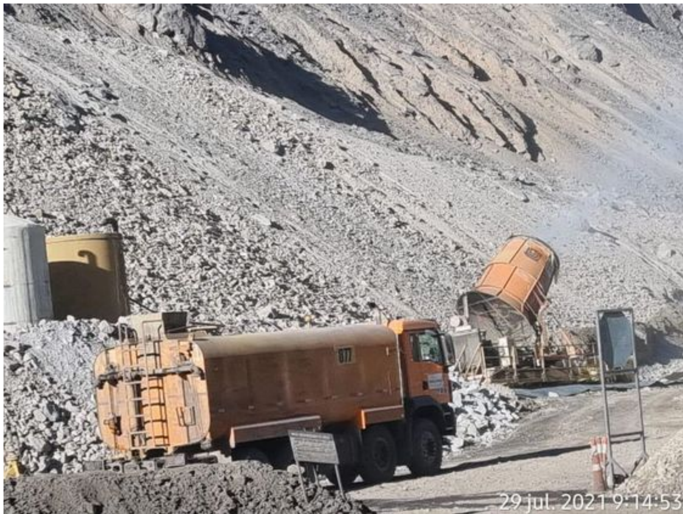
Foto 13: Medida: Fogcannon 2. Lugar: . Comentarios: equipo operativo