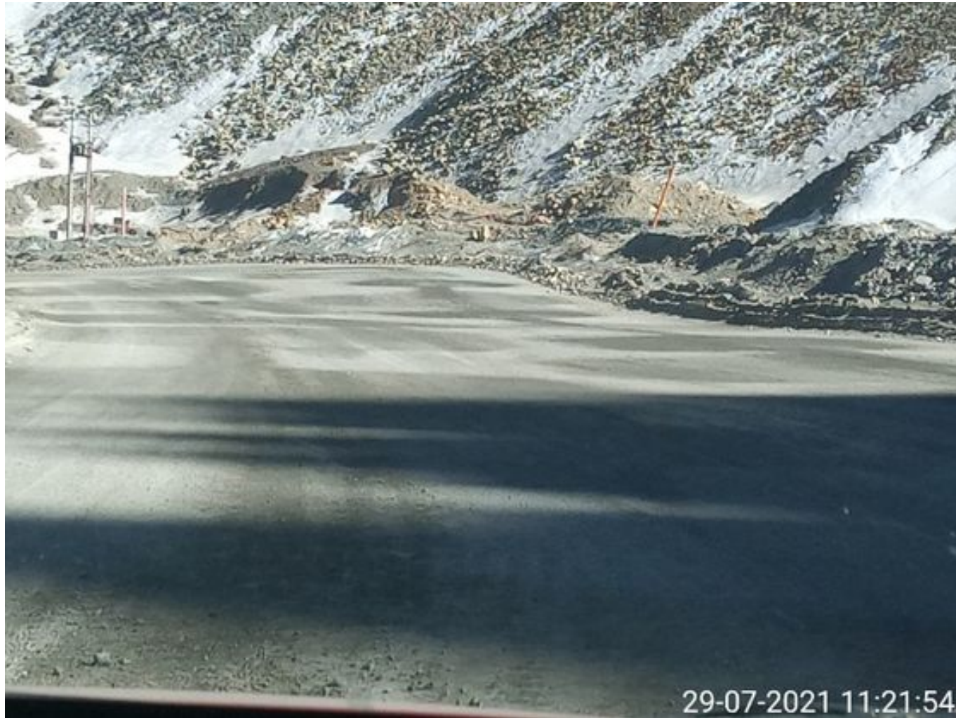
Foto 9: Medida: Riego de caminos EPSA Cerro Amarillo. Lugar: Fases superiores. Comentarios: Rampas con riego entre cortado con 1 camion aljibe epsa operativo, fuentes de emisión tránsito de Caex