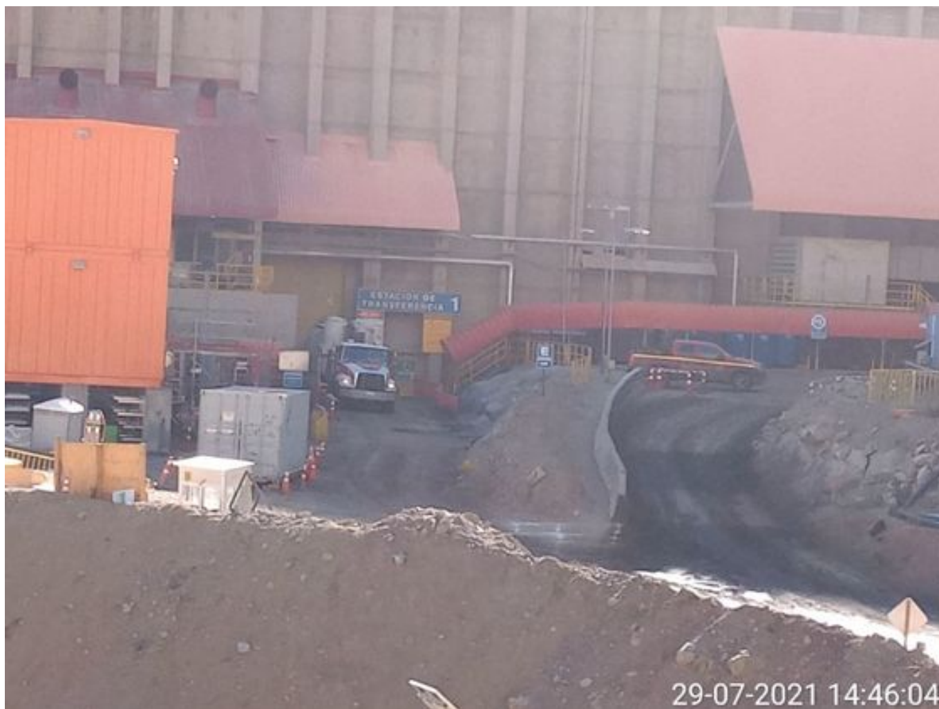
Foto 15: Medida: Limpieza con camión super sucker. Lugar: Chancado y correas. Comentarios: equipo operativo en estación de transferencia 1