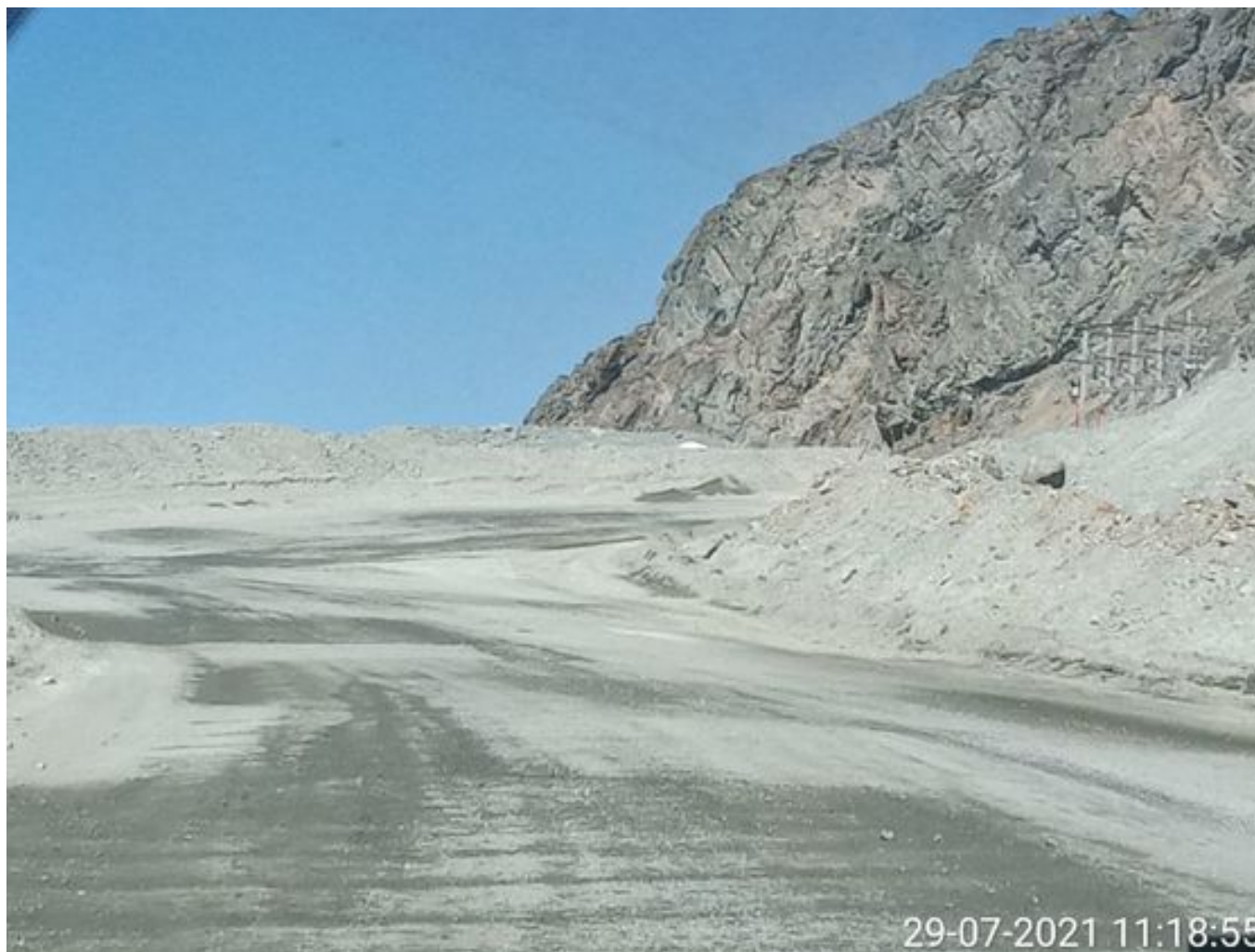
Foto 10: Medida: Riego de caminos EPSA Cerro Amarillo. Lugar: Fases superiores. Comentarios: Rampas con riego entre cortado con 1 camion aljibe epsa operativo, fuentes de emisión tránsito de Caex