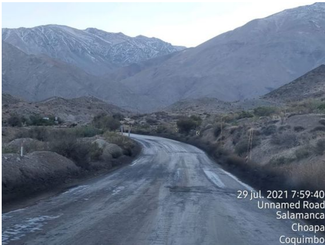
Foto 38: Medida: Aplicación Dust Control. Lugar: Portones a Chacay. Comentarios: camino con aplicación de producto operativo