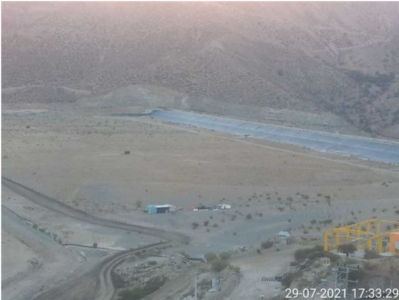
Foto 44: Medida: Aplicación de εμπρετίτο. Lugar: Sector Tranque. Comentarios: no se observan trabajos en el área