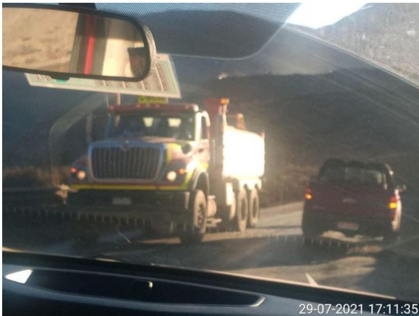
Foto 53: Medida: Riego de caminos en frentes de trabajo. Lugar: INCO. Comentarios: camino con riego operativo se observa 1 camion aljibe de bechtel en el área