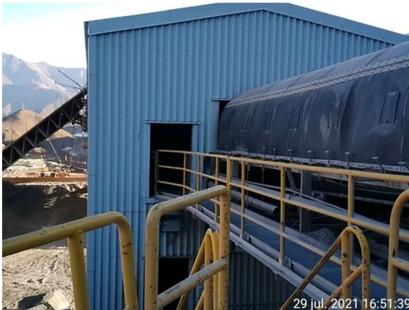
Foto 49: Medida: Regaderas. Lugar: Descarga stock pile planta. Comentarios: correas detenidas por falta de mineral en proceso en stock pile de chancado, se observa material particulado de un excavadora que se observa trabajando en el área