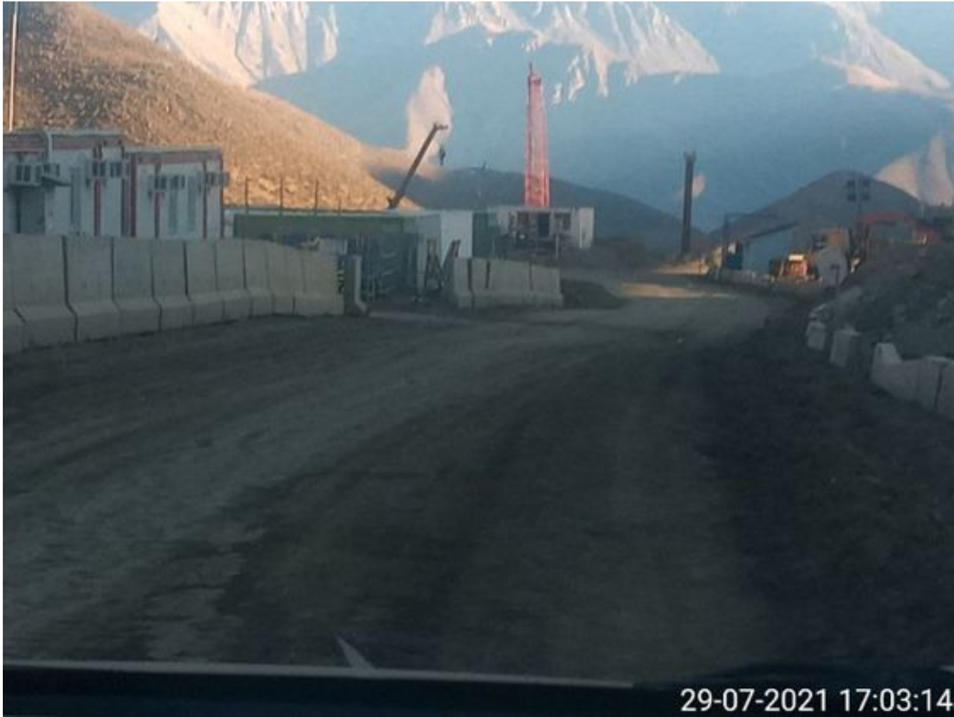
Foto 54: Medida: Riego de caminos en frentes de trabajo. Lugar: INCO. Comentarios: camino con riego operativo se observa 1 camion aljibe de bechtel en el área