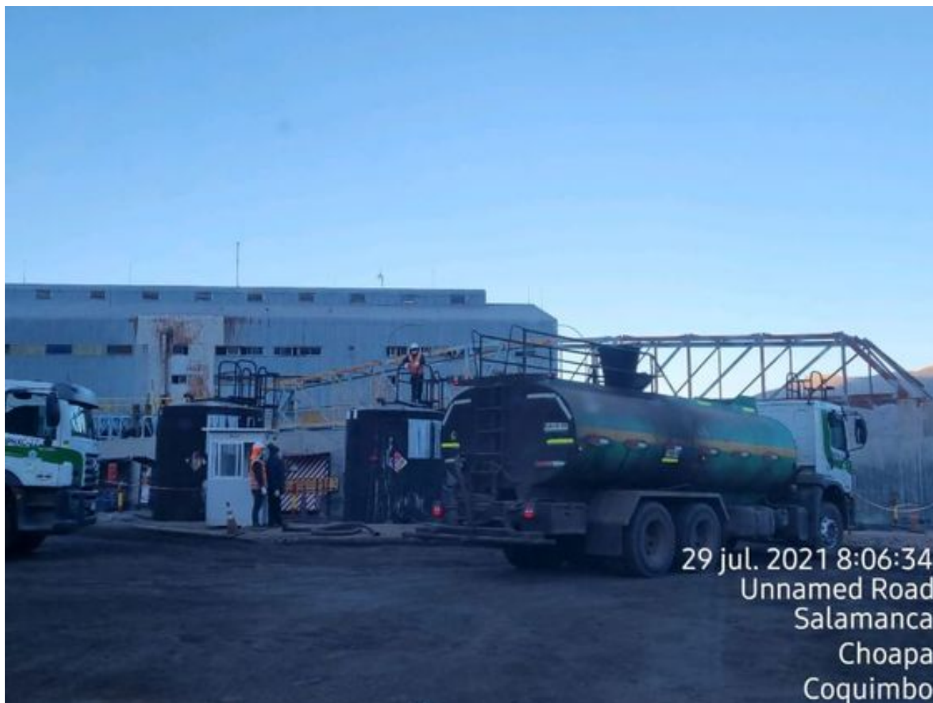
Foto 29: Medida: Stock de producto. Lugar: Bodega. Comentarios: stock producto 28.013 litros, 5 camiones en circuito más 1 backup , barredora realiza trabajos en el sector chacay