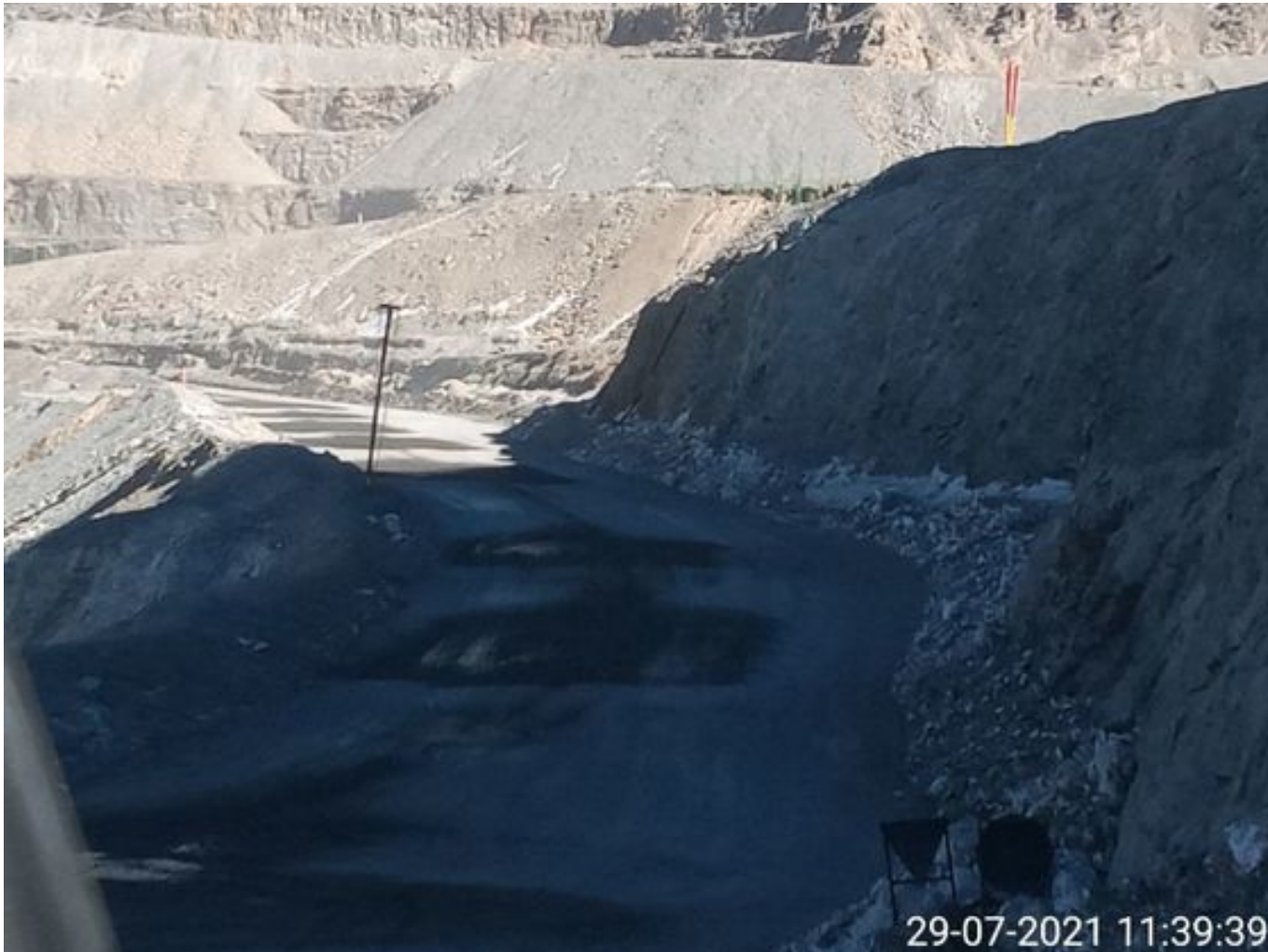
Foto 6: Medida: Riego de caminos. Lugar: Fases superiores. Comentarios: rampas con riego entre cortado con 3 camiones aljibes besalco ( 815 , 815 , 897 ) y 2 cachimbas operativas , medida de regadío no es suficiente para mitigar material particulado, fuentes de emisión tránsito de Caex , equipos de apoyo y carguío , laderas y pretils por fuertes vientos