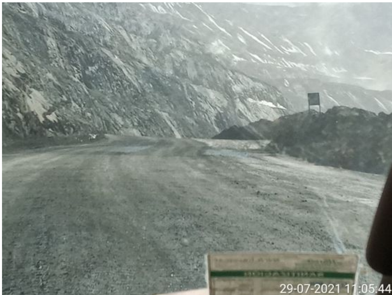
Foto 1: Medida: Riego de caminos. Lugar: Fases Intermedias. Comentarios: rampas con riego y aplicación de producto entre cortado con 2 camiones aljibes besalco en pistas y 3 cachimbas operativas, medida de regadio no es suficiente para mitigar material particulado, fuentes de emisión tránsito de Caex, equipos de apoyo y carguío , descarga de caex en taza de chancado.