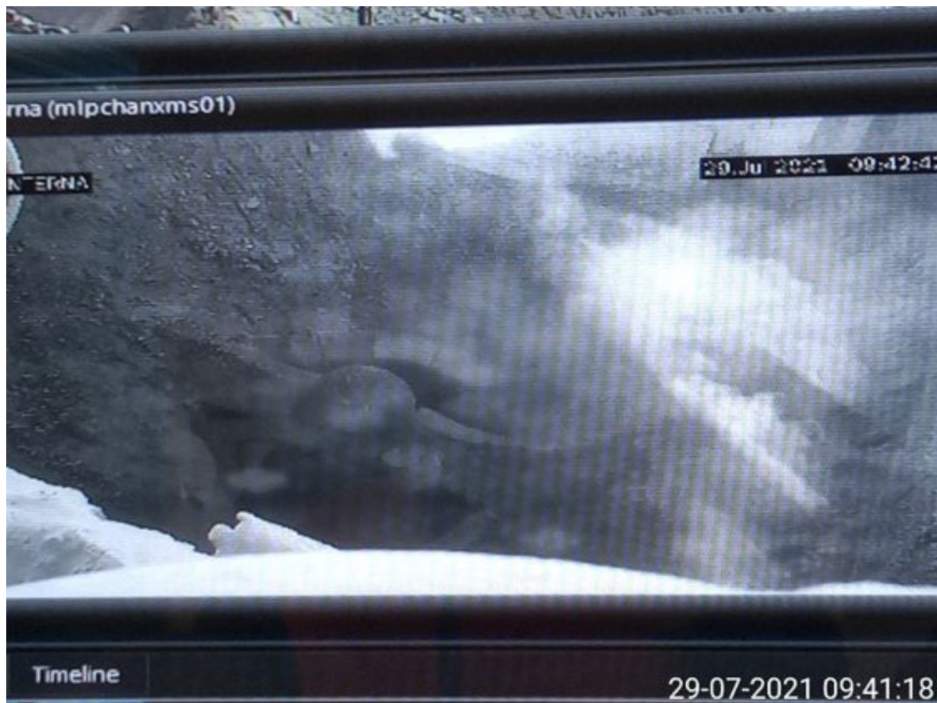
Foto 22: Medida: Supresor de polvo. Lugar: Taza Chancado 1. Comentarios: supresores se observan operativos pero medida no es suficiente para mitigar material particulado en descarga de caex en taza de chancado