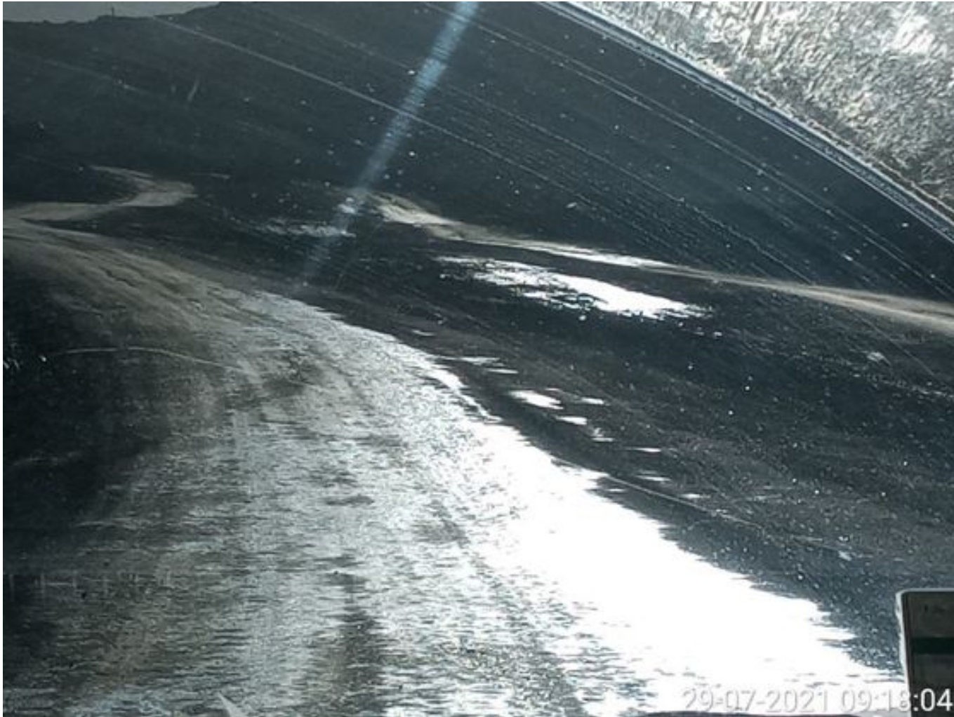
Foto 11: Medida: Aplicación anticongelante. Lugar: Caminos Interior Mina. Comentarios: anticongelante operativo