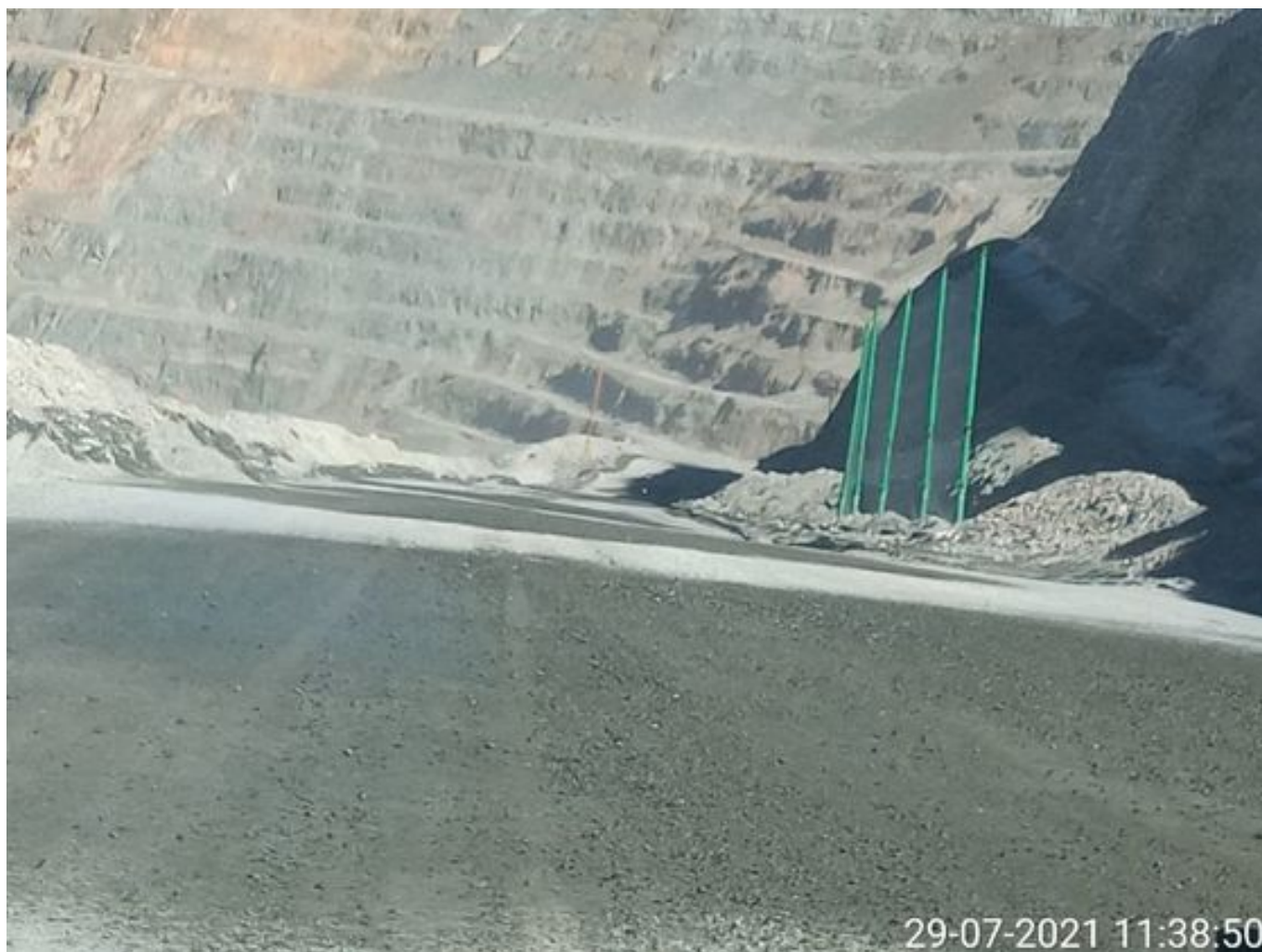
Foto 5: Medida: Riego de caminos. Lugar: Fases superiores. Comentarios: rampas con riego entre cortado con 3 camiones aljibes besalco ( 815 , 815 , 897 ) y 2 cachimbas operativas , medida de regadío no es suficiente para mitigar material particulado, fuentes de emisión tránsito de Caex , equipos de apoyo y carguío , laderas y pretilas por fuertes vientos