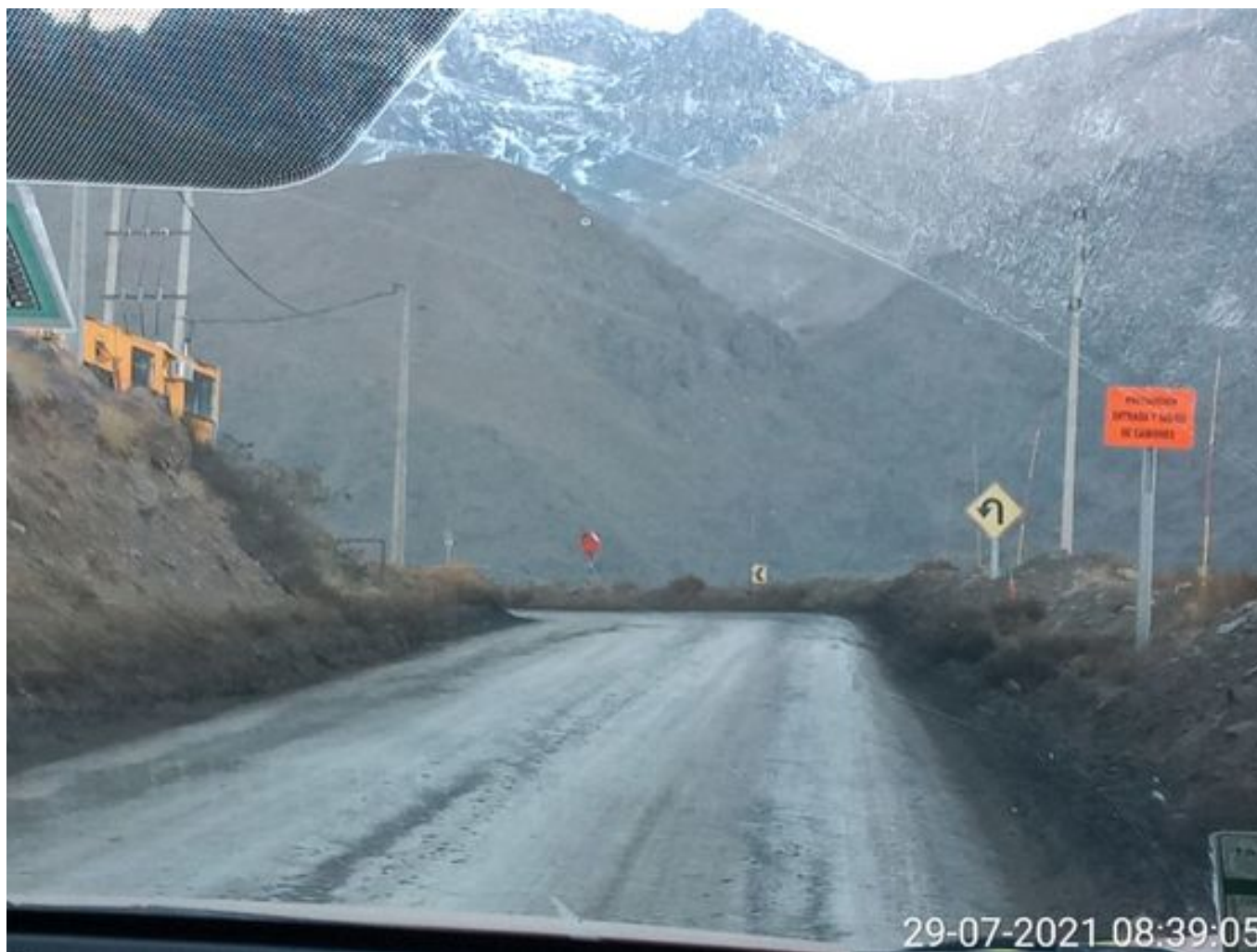
Foto 37: Medida: Aplicación Dust Control. Lugar: Chacay a Quillay. Comentarios: Camino con aplicación de producto operativo