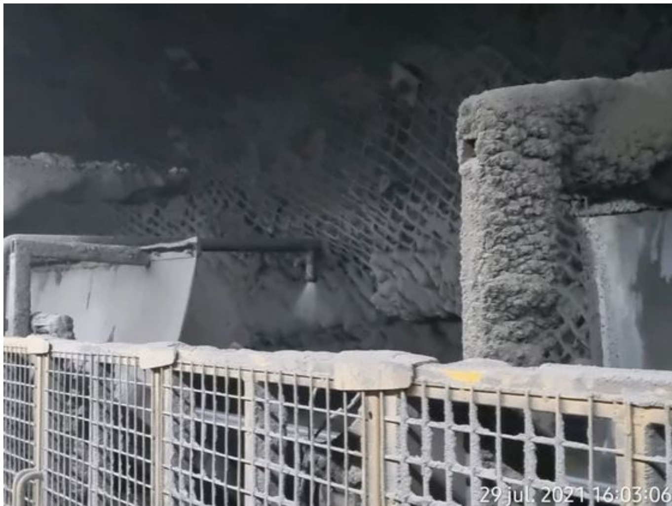
Foto 26: Medida: Regaderas. Lugar: TP1. Comentarios: 3 regaderas operativas en el área