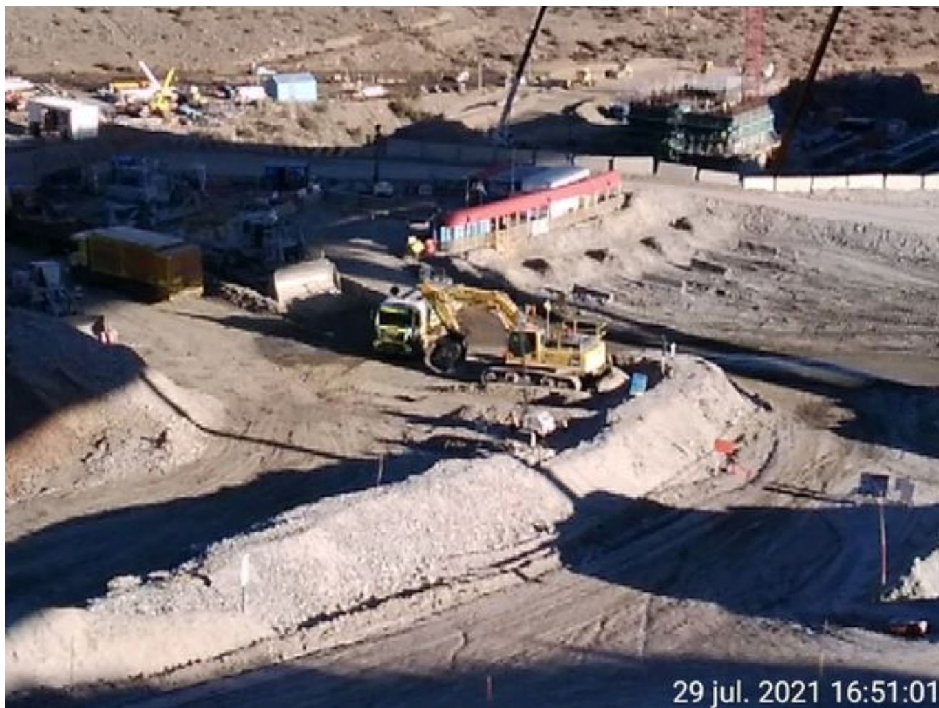
Foto 50: Medida: Riego Caminos. Lugar: Stock pile planta. Comentarios: riego de caminos operativo se observa un camión aljibe besalco humectando