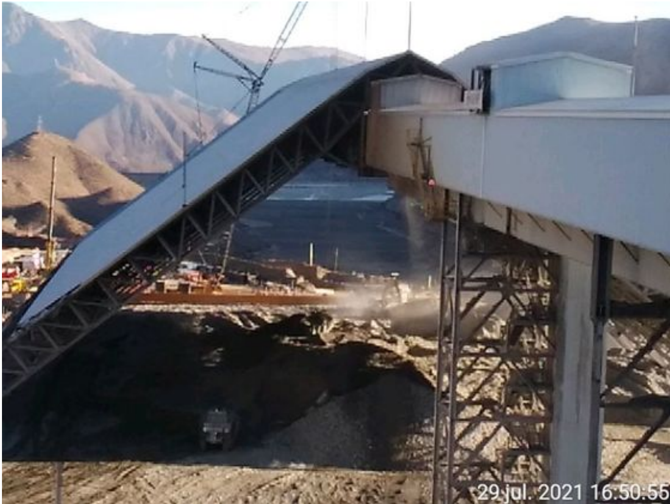
Foto 48: Medida: Regaderas. Lugar: Descarga stock pile planta. Comentarios: correas detenidas por falta de mineral en proceso en stock pile de chancado, se observa material particulado de un excavadora que se observa trabajando en el área