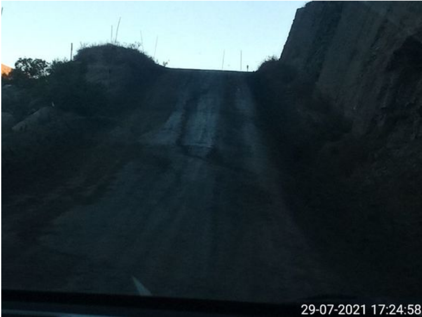
Foto 31: Medida: Aplicación Dust Control camino alternativo. Lugar: Estribo derecho Tranque Quillayes. Comentarios: camino con aplicación de producto operativo