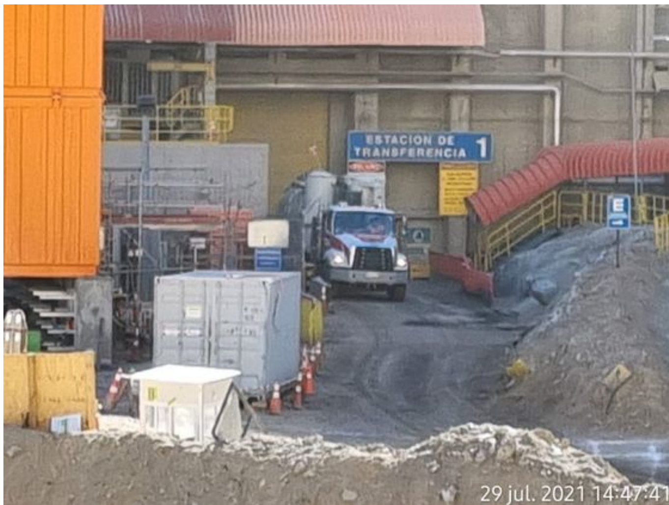
Foto 14: Medida: Limpieza con camión super sucker. Lugar: Chancado y correas. Comentarios: equipo operativo en estación de transferencia 1