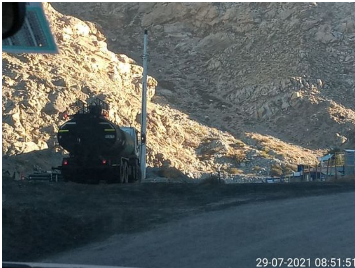
Foto 35: Medida: Aplicación Dust Control. Lugar: Quillay a Hotel Mina. Comentarios: camino con aplicación de producto operativo