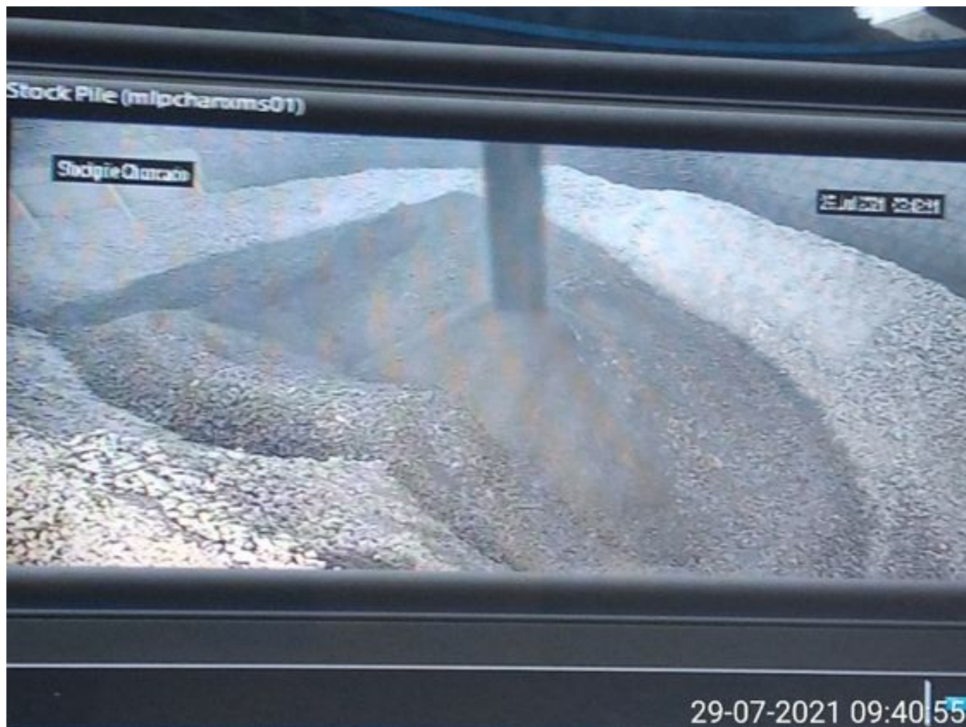
Foto 19: Medida: Espumante en Correas y Stock Pile. Lugar: Chancado 1. Comentarios: producto operativo stock TK 3.870 litros y ambas bombas al 20%