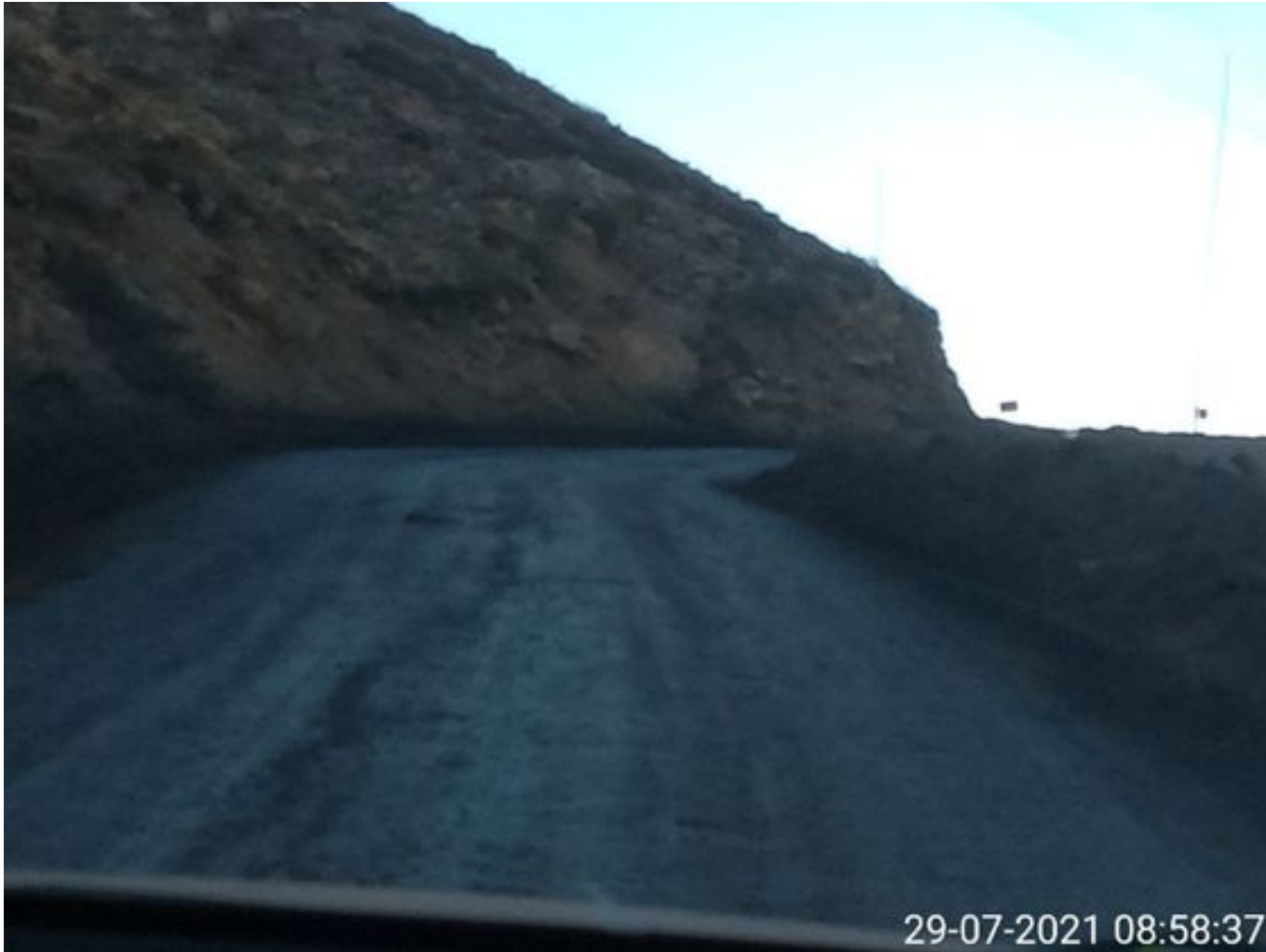
Foto 33: Medida: Aplicación de producto Corp. Vial. Lugar: Hotel Mina a Garita Mina. Comentarios: camino con aplicación de producto operativo