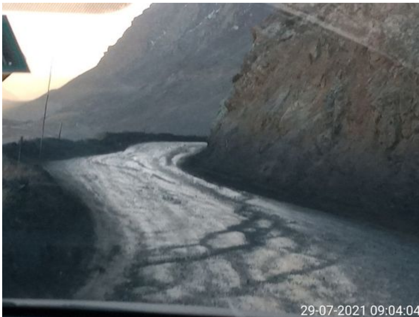
Foto 4: Medida: Riego de caminos. Lugar: Fases Inferiores. Comentarios: rampas con aplicación de producto operativo entre cortado con 3 camiones Das en circuito más 1 backup , botaderos detenidos por mp10