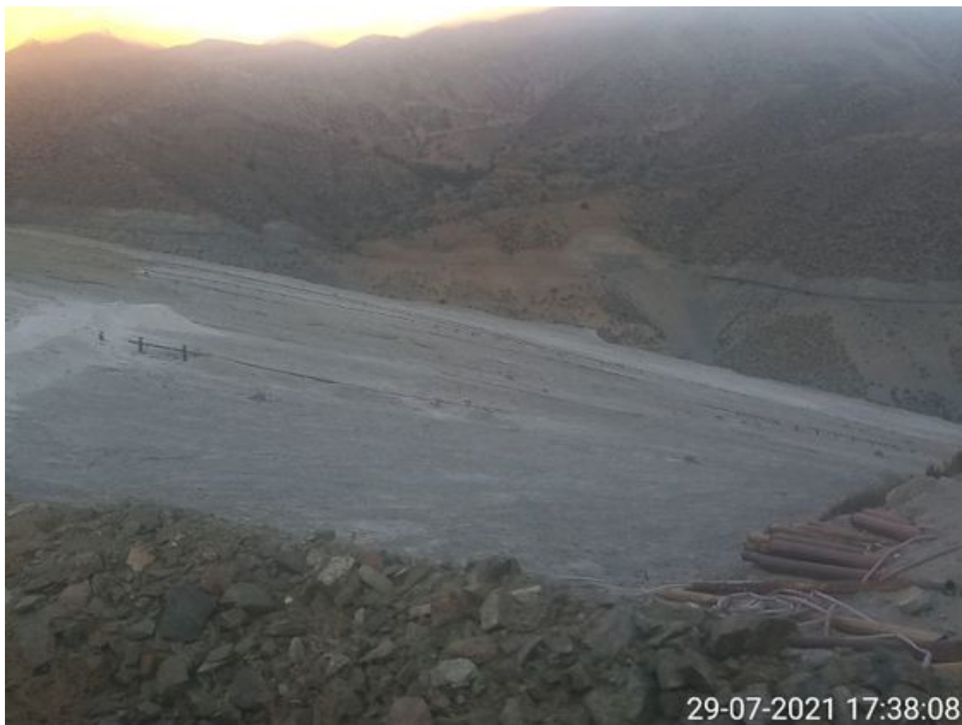
Foto 41: Medida: Aplicación de supresor. Lugar: Sector Muro. Comentarios: no se observan trabajos en el área