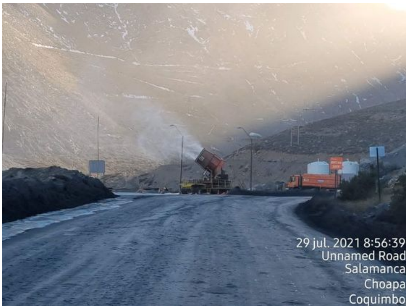
Foto 8: Medida: Fogcannon 1. Lugar: . Comentarios: equipo operativo