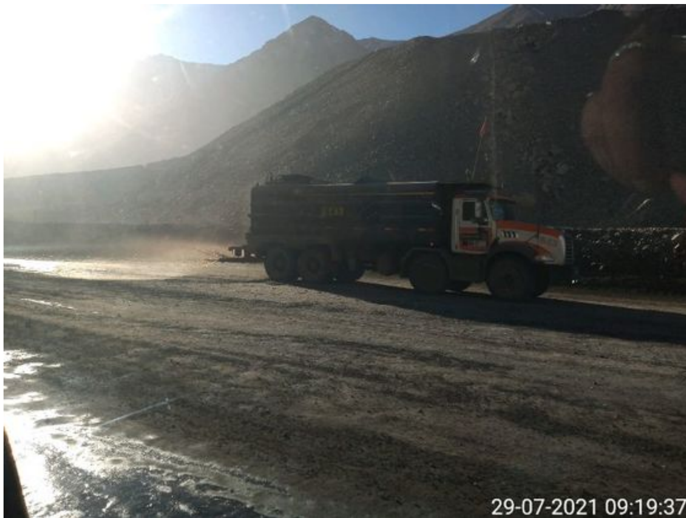
Foto 3: Medida: Riego de caminos. Lugar: Fases Inferiores. Comentarios: rampas con aplicación de producto operativo entre cortado con 3 camiones Das en circuito más 1 backup , botaderos detenidos por mp10