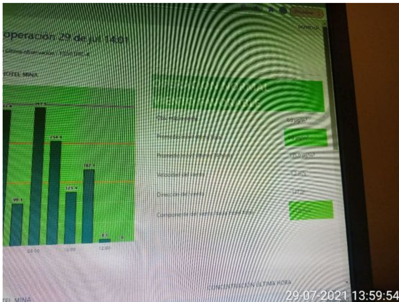
Foto 56: Medida: Paralización de equipos de carguío. Lugar: Medida Adicional. Comentarios: se presenta alerta 2 pronosticada de 8 a 9 hrs con un promedio hora de 341 ug/m3 , en la fotografía se observa en detalle los equipos detenidos por mp10 ,queda operacion normal a las 12:04 hrs .