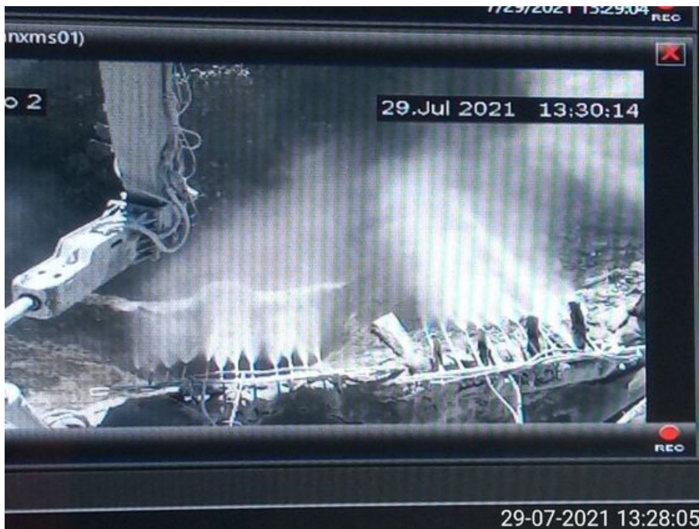
Foto 20: Medida: Supresor de polvo. Lugar: Taza Chancado 2. Comentarios: supresores se observan operativos pero medida no es suficiente para mitigar material particulado en descarga de caex en taza de chancado