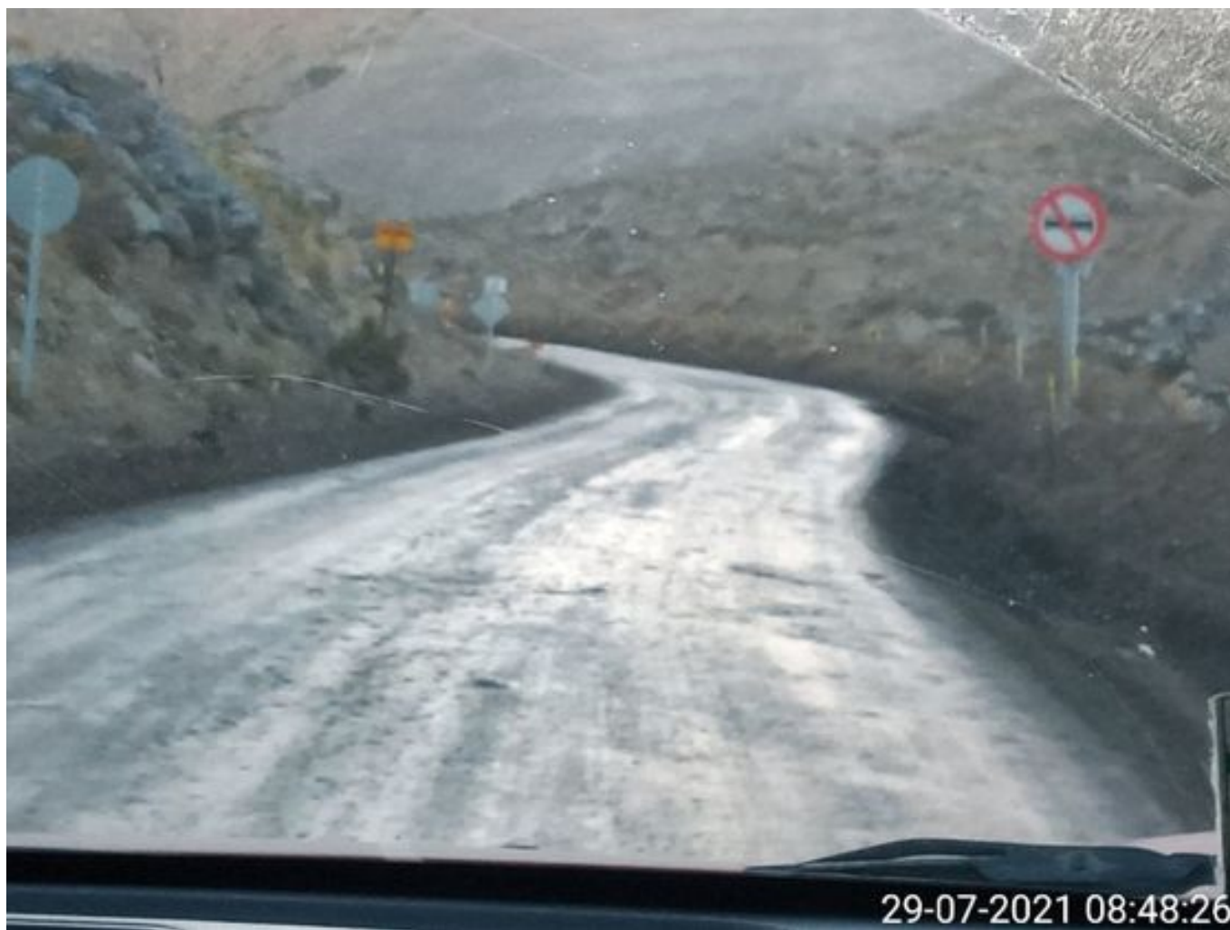
Foto 34: Medida: Aplicación Dust Control. Lugar: Quillay a Hotel Mina. Comentarios: camino con aplicación de producto operativo