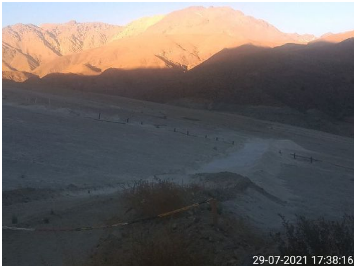
Foto 42: Medida: Aplicación de supresor. Lugar: Sector Muro. Comentarios: no se observan trabajos en el área