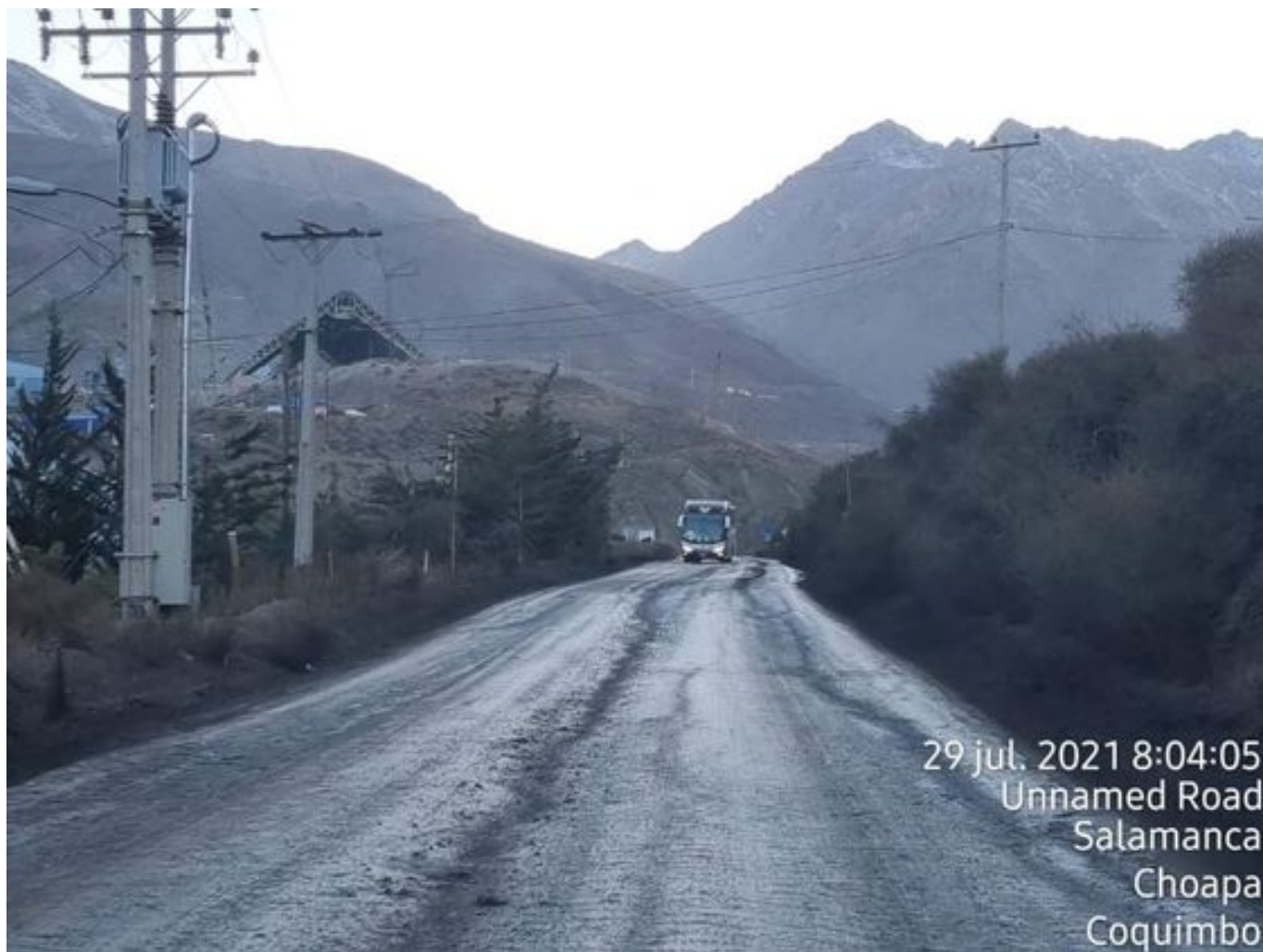
Foto 39: Medida: Aplicación Dust Control. Lugar: Portones a Chacay. Comentarios: camino con aplicación de producto operativo