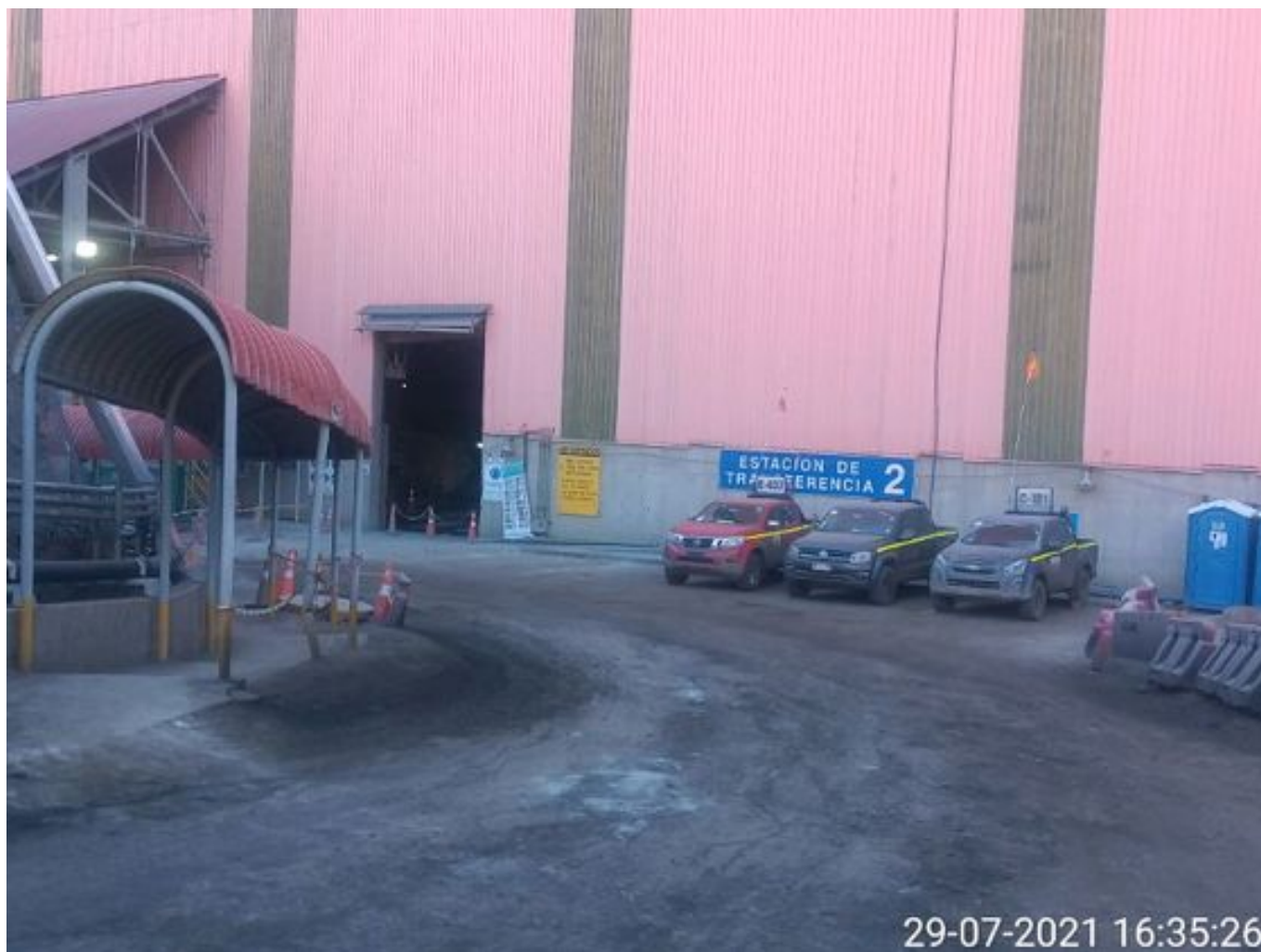
Foto 24: Medida: Regaderas. Lugar: TP2. Comentarios: correas detenidas por falta de mineral en proceso en stock pile de chancado