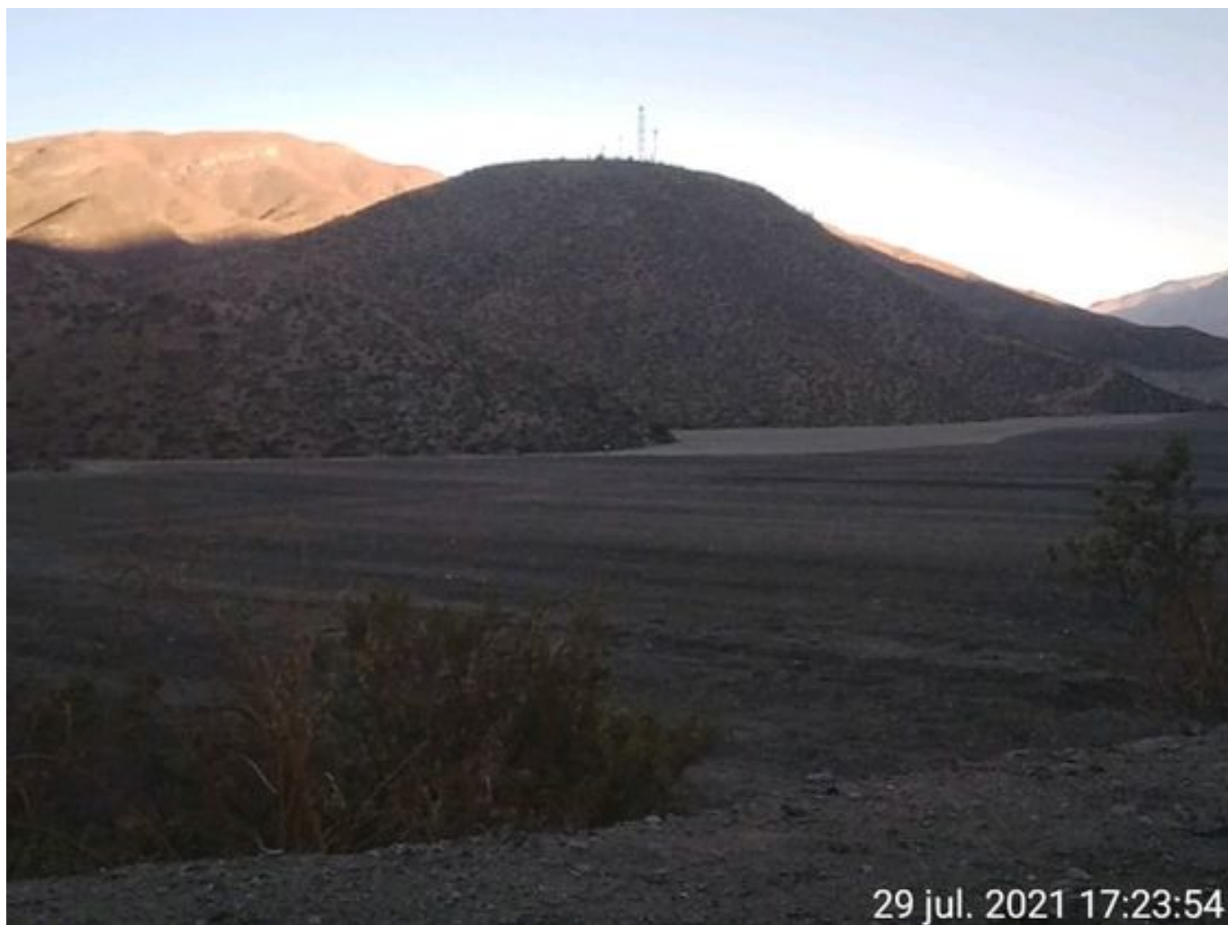
Foto 46: Medida: Aplicación de empréstito. Lugar: Sector Cola. Comentarios: no se observan trabajos en el área