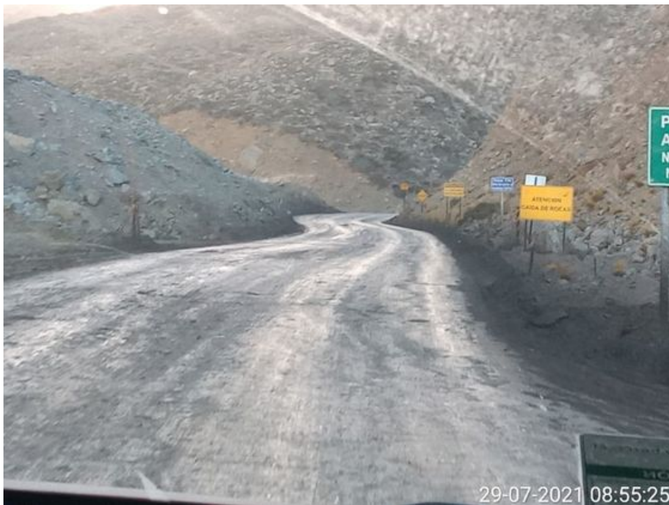
Foto 32: Medida: Aplicación de producto Corp. Vial. Lugar: Hotel Mina a Garita Mina. Comentarios: camino con aplicación de producto operativo