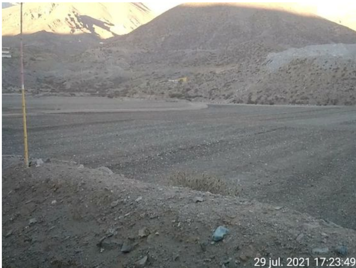
Foto 47: Medida: Aplicación de empréstito. Lugar: Sector Cola. Comentarios: no se observan trabajos en el área